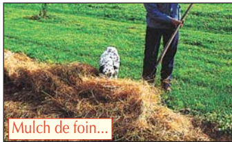
...Mulch de foin...