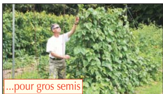
...pour gros semis

«Ce foin dont vous couvrez la terre contient de millions de graines : écartez ce mulch pour semer, et c'est aussitôt «l'explosion» des graines indésirables. : semées ainsi, les minuscules levées de carottes, thym, salades... devront être méticuleusement sarclées».