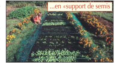
...en «support de semis

Résultat : un support de semis idéal pour toutes les semences fines : on couvre la terre nue de 2 à 3 cm de ce compost. Les graines, semées sur cette couche, juste tassées, prennent une telle avance sur les graines indésirables de la terre, sous la couche de compost, qu'aucun sarclage n'est nécessaire. Sous réserve de bonnes techniques décrites dans notre guide.