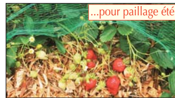
...pour paillage été

Pour ces graines fines il faut donc une AUTRE MÉTHODE :