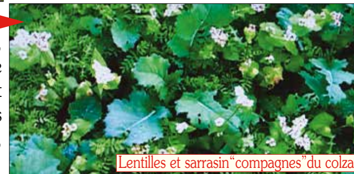
Lentilles et sarrasin "compagnes" du colza