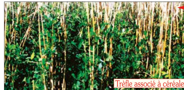
Trèfle associé à céréale

Les associations de cultures. Les bienfaits de l'association de couverts se retrouvent dans l'association de cultures : espèces et variétés peuvent être mélangées au bénéfice de la résistance et de la productivité. Les exemples se multiplient, en de nombreuses pratiques, chaque année plus ingénieuses.