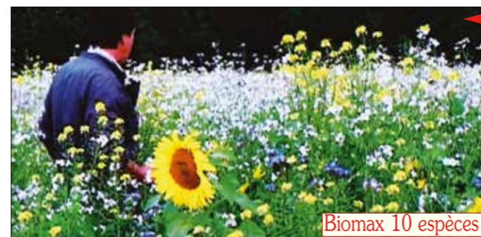
Biomax 10 espèces

Et parallèlement à ces 5 piliers, des innovations sont arrivées . De nouveaux matériels sont proposés par des firmes et parfois "autoconstruits". De nouvelles espèces et variétés de cultures et de couverts sont obtenues par des semenciers, et testées par des agriculteurs et éleveurs. Et ces "trouvailles" sont échangées en groupements, avec le démultiplicateur que sont les techniciens, les articles et les DVD. Citons quelques unes de ces trouvailles ou simplement de tendances :