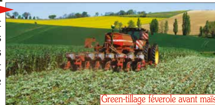
Green-tillage féverole avant maïs

Le remplacement de la chimie. Le gel et de nouveaux roulages et scalpings remplacent de plus en plus le glyphosate. Et des rotations bien plus longues désorientent à la fois les levées adventices et les parasites animaux, dont les ennemis sont favorisés par la biodiversité des cultures, des couverts et abords végétaux.