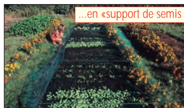
...en «support de semis»

Résultat : un support de semis idéal pour toutes les semences fines : on couvre la terre nue de 2 à 3 cm de ce compost. Les graines, semées sur cette couche, juste tassées, prennent une telle avance sur les graines indésirables de la terre, sous la couche de compost, qu'aucun sarclage n'est nécessaire. Sous réserve de bonnes techniques décrites dans notre guide.