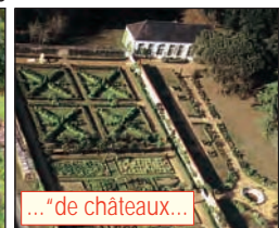
... "de châteaux"...