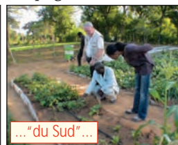
... "du Sud"...